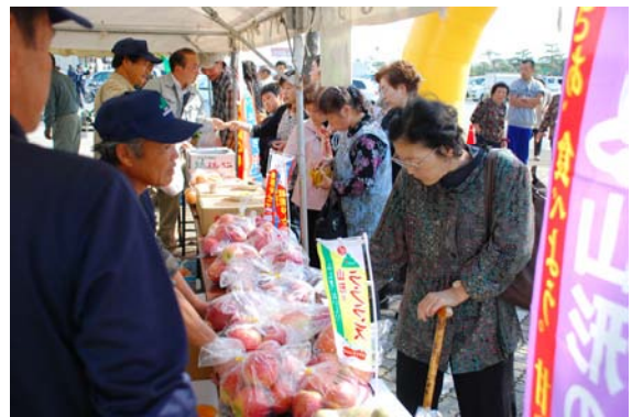
農業と物産まつり