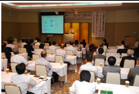
産学官連携交流会

◇問17 上記の取組みについて、お聞きます。該当する番号・記号に○をつけてください。