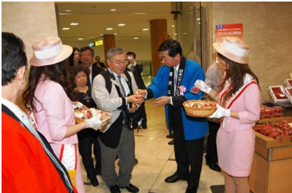
都内でのトップセールス