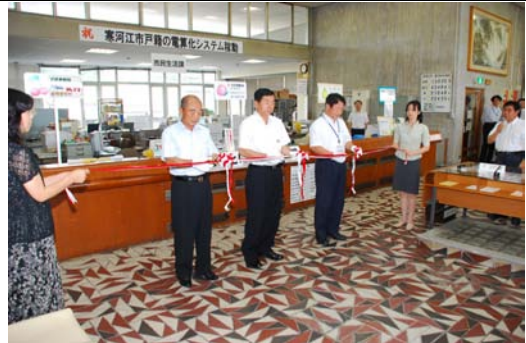
戸籍電算化による交付開始