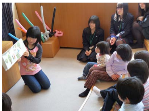
高校性ボランティアのおはなし会

◇問26 上記の取組みについて、お聞きます。該当する番号・記号に○をつけてください。