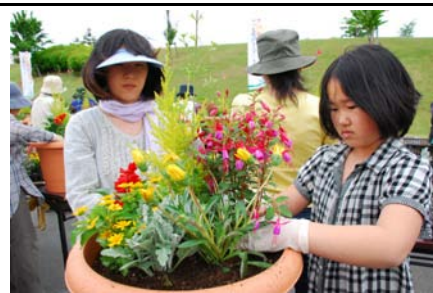
花咲かフェアで展示するバスケットづくり