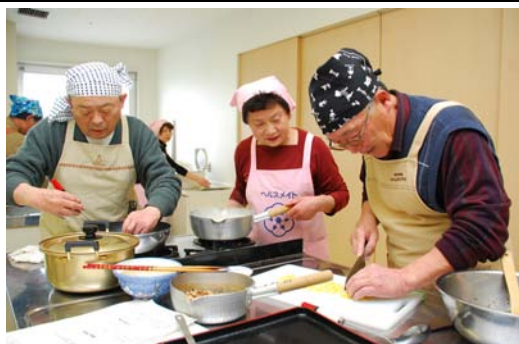
介護予防栄養講座