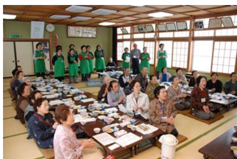
高齢者ふれあいサロン