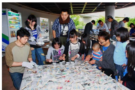
花あかり月うかげIN花咲かフェアキャンドル作り