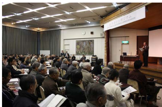
慈恩寺シンポジウム