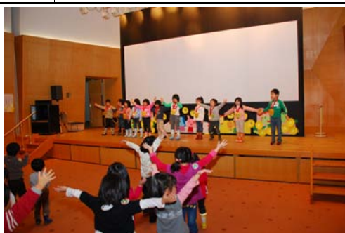
かもしかクラブ修了式