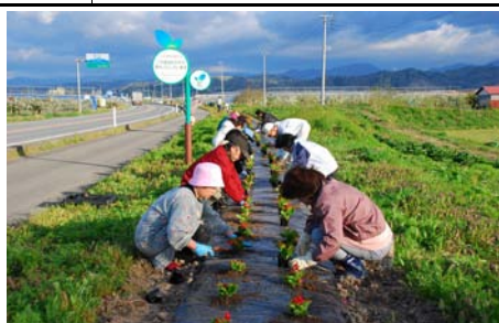
フラワーロード・花いっぱいまちづくり植栽