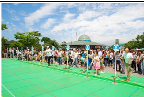
さくらんぼの種吹きとばし大会