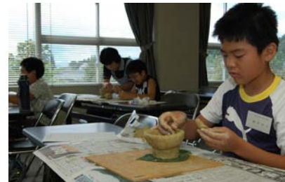
少年少女郷土史講座