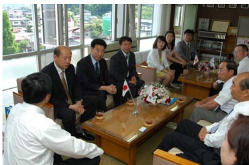
大韓民国安東市訪問団の来寒