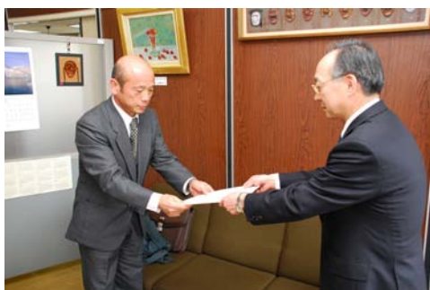
教育振興計画の見直しの答申

◇問24 上記の取組みについて、お聞きます。該当する番号・記号に○をつけてください。