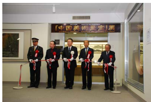
「中国美術至宝」展の開幕

◇問16 上記の取組みについて、お聞きます。該当する番号・記号に○をつけてください。