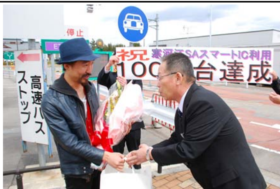
スマートIC100万台達成記念

◇問11 上記の取組みについて、お聞きします。該当する番号・記号に○をつけてください。