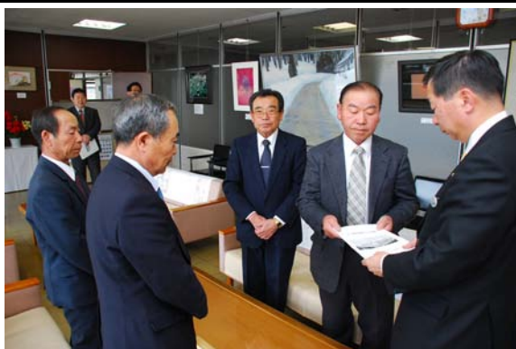
幸生・田代地区の地域づくり計画書の提出

◇問22 上記の取組みについて、お聞きます。該当する番号・記号に○をつけてください。