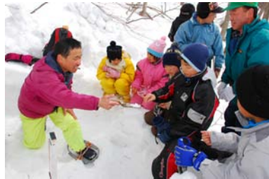
幸生小「冬の森林体験」