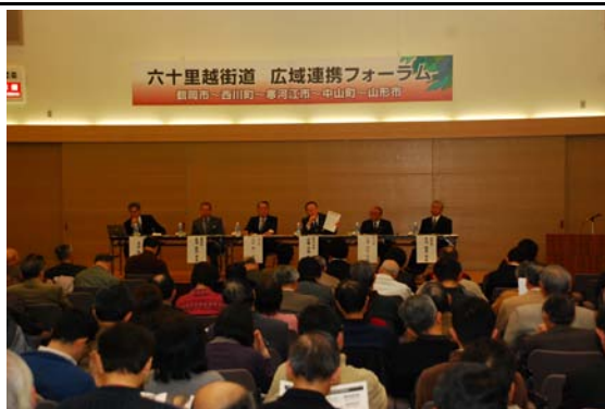
六十里越街道広域連携フォーラム

◇問29 上記の取組みについて、お聞きます。該当する番号・記号に○をつけてください。