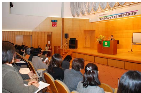
「寒河江のごっつお」出版記念講演会