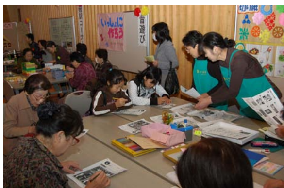
ボランティアフェスティバル