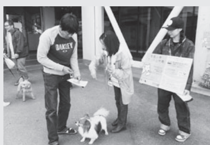
狂犬病予防注射の会場での活動