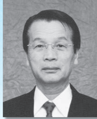
議長 内藤 明