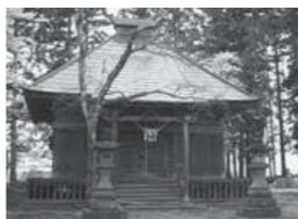
八鍬鹿島神社拝殿

今後、「絹本著色地藏十王像」は、県公報による告示を経て正式に指定されます。この3件の指定により、本市所在の県指定文化財は39件、市指定文化財は150件となります。