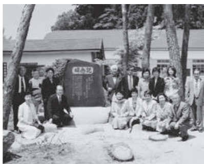
寒河江服装専門学校記念碑

設された。その後、寒河江服装専門学校と校名を変え、五十五年間の長きにわたって五千名にも上る卒業生を世に送り、平成十七年(二〇〇五)閉校となった。冬期には、西川町や大江町の山内からも宿泊して学ぶ子女たちがいた。多くの生徒が集い、熱意ある教職員が守り続けた学校も、少子化による生徒数の極端な減少によって存続が困難となったのであった。