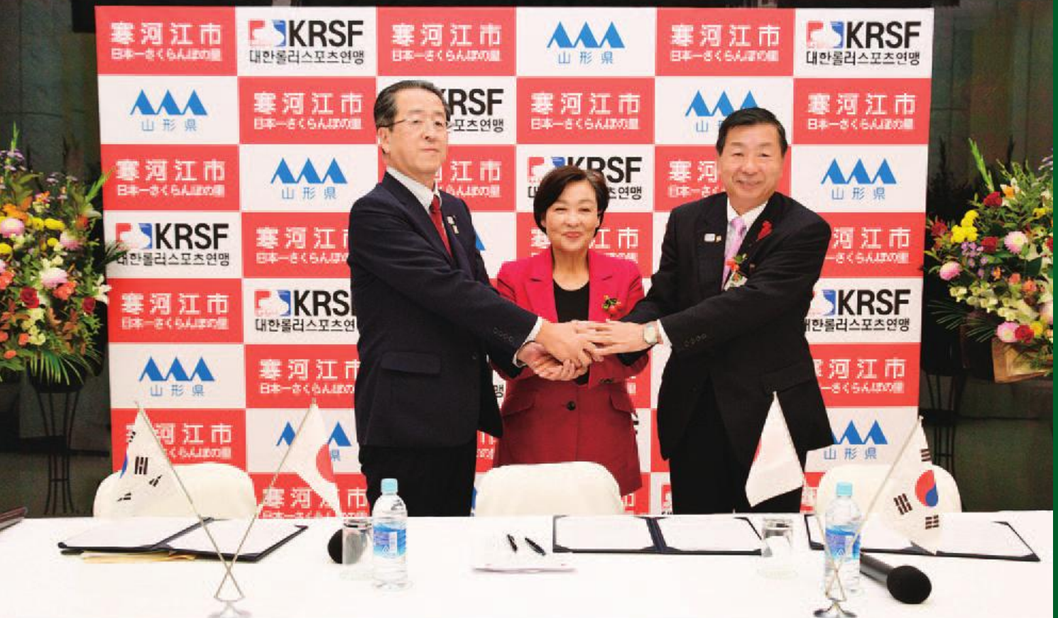
写真左 大澤賢史県観光文化スポーツ部長、写真中央 キム・ヨンスン大韓民国ローラースポーツ連盟会長、写真右 佐藤洋樹市長