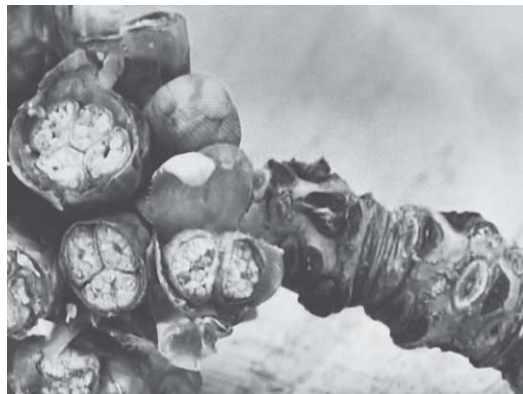
霜害を受けてめしべが凍死したさくらんぼのつぼみ断面

佐藤錦の2〜6割程度、紅秀峰の4〜8割程度の凍霜害は、甚大な被害だ。防霜対策の燃焼資材や