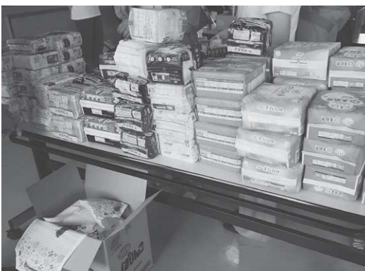
大学生に支援するために寄せられた生理用品

教育長 ②生理についての教育や指導のあり方について教職員間でしっかりと議論し、共通理解を図った上で、全ての児童生徒が生理に関する知識・理解を深めるという観点から検討してまいります。