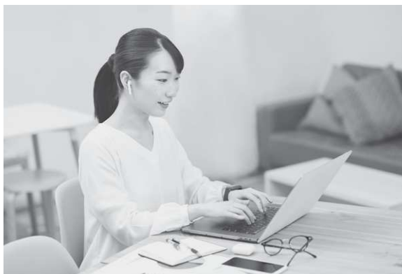
時間を気にすることなく、行政手続きができる時代へ

市長 ① 一元管理にあたる担当課において、庁内全体の審議会等の開催予定時期を把握し、集中的な開催を回避するなど、平準化が図られるよう進行政管理を徹底します。 ② 現行の審議会等の設置目的が社会動向に合致しているかを再検証し、類似する組織の統合や廃止など、全庁的な視点から整理合理化を実施します。