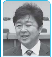
渡邊 賢一 議員