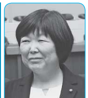
太田 陽子 議員