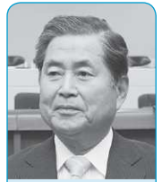
阿部 清 議員