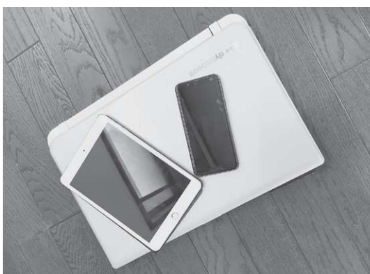
これから主流になるであろうネット予約

市長 自治体を対象とした災害時の保険として、防災・減災費用保険制度があります。市では、当該保険の加入について検討を行いました。財政調整基金の積立てなどにより財源を確保し、早期の避難指示等により市民の生命・財産を守るための取り組みを進めてまいります。