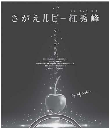
来年こそは「さがえルビー紅秀峰」をたくさん輝かせよう

②収入保険制度に対する助成支援をするのであれば、県内農業者に対し同等になされることが望ましいと考えます。県への支援要請と併せ市の負担も検討し、県と連携して本制度への加入促進に向けた環境づくりを進めてまいります。