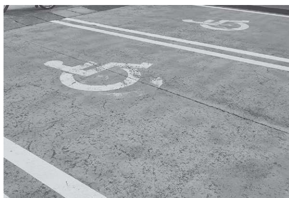
車いす利用者等が駐車するブルーペイント

フリーシボルマークの掲載をする等、検討してまいります。 教育長 ③各小中学校の総合的な学習の時間やボランティア活動において、有効な手立ての一つであり、参考とさせていただきます。 市長 ④障がいのあるなしに関わらず一緒に遊ぶことができる遊具を整備することは必要であると考えており、既存遊具の更新時や屋内外の遊戯施設など、チェリーランドの再整備時においても、インクルーシブな遊具の設置について検討してまいります。