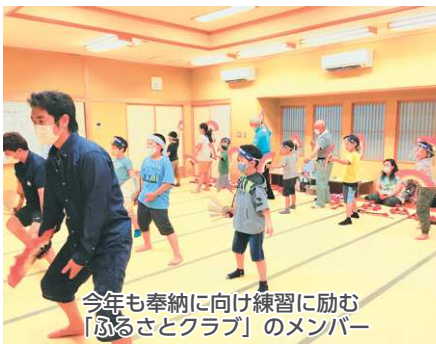
今年も奉納に向け練習に励む「ふるさとクラブ」のメンバー