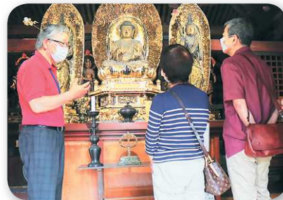
寒河江駅での観光案内や慈恩寺のガイドをして くださる、さくらんぼの里観光ボランティアガイド