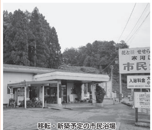
移転・新築予定の市民浴場

② 新しい市民浴場について広く市民の方から意見をお聞きするため、市民浴場と各地区公民館の5カ所に9月までアンケートボックスを設置しました。8月20日時点での意見総数は51人で、料金や設備など様々な意見をいただいております。