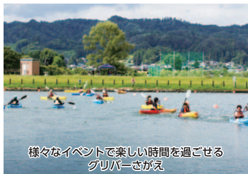
様々なイベントで楽しい時間を過ごせるグリバーさがえ

南部地区は、昔からの3地域(高屋、皿沼、島)の11町会と、昭和にできた5地域(5町会)から構成された田園地帯です。地域には、グリバーさがえと市民浴場があります。グリバーさがえには、全国でも珍しいカヌー場が設置されており若者が練習や体験等で、