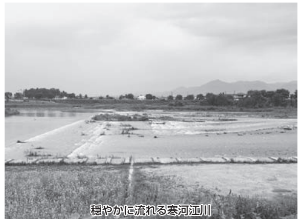
穏やかに流れる寒河江川

市長 ①国土交通省の見解では、逆流現象が起こる可能性があると回答をいただいています。 ②市内8地区を巡回し地震を想定した防災訓練を実施していますが、