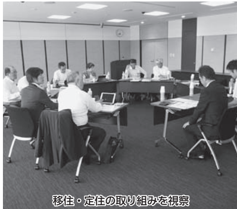
移住・定住の取り組みを視察

ーズに、人口の社会増に向けた重点4分野を①子育て、②仕事、③住まい、④移住・定住として定住基盤を整備し、子育て世代の流出抑制とUイターン人口の増加を図るとしている。特に移住定住対策では、移住定住の総合窓口に定住企画員2人と定住推進員3人の専属スタッフを配置し、人材を呼び込む企画等を行っている。特徴的な制度には「家を建てたら出ていかない」との考えから、Uイターン者の宅地購入に対する