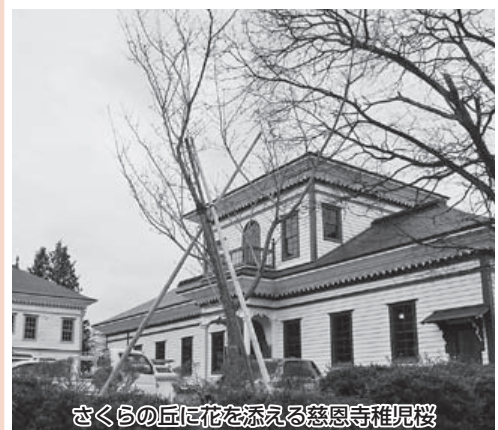
さくらの丘に花を添える慈恩寺稚児桜

市長 ①寒河江公園再整備計画に基づき、平成27年度は市道寒河江公園アクセス線の用地費に6445万円、平成28年度は同事業の用地費と整備費に1億6930万円、平成29年度は同事業整備費として7310万円、ベンチ等修繕に2