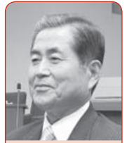
阿部 清 議員