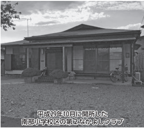
平成29年10月に開所した 南部小学校区の第2なかよしクラブ