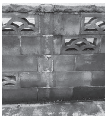
定期的なブロック塀の調査を

大阪北部地震、西日本豪雨、山形豪雨、台風21号、北海道地震と今や日本列島は悲鳴を上げている。