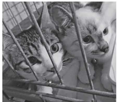
保護猫譲渡会(里親さがし)の小さな生命

勢手術に対する行政の補助が要望されている。動物愛護団体のボランティアや寄付を募って活動されている予算も年々増え続け、切実な状況だ。ぜひ、要望に応えてほしい。また、マイクロチップ装着や地域猫活動の普及等、今後の対策について伺う。