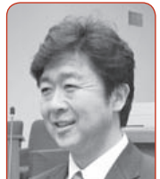
渡邊 賢一 議員

者で組織する4つの運営委員会に、それ以外の小学校区にある5つの運営委員会に運営を委託しています。それぞれの運営委員会の成り立ちも異なっており、統一した運営体制の導入にはいろいろ課題がありますが、今後、運営委員会の負担軽減・適正な運営の方策について話し合いを持ち検討していきます。 ②支援員の補充調整は、同じ運営委員会では可能ですが、他の運営委員会間では、給与体系や財源が異なるため、すぐには難しい状況です。今後検討していきます。 ③寒河江市放課後児童クラブ連絡会に情報提供するなどして活用を検討し、運営委員会の負担軽減を図っていきます。 ④わんぱくクラブのグラウンドは浸透排水ですが、水はけが悪い状況です。対応策を検討し、できるだけ早く対策を講じます。