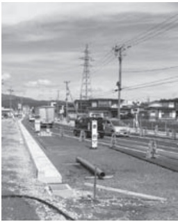
市民生活向上のための 予算執行を

市長 ①12年ぶりの人口の転入超過は、少子化対策などの成果と考えています。人口減少に対応する施策を持続発展させ体系的に取り組む必要性を認識しており、自然動態の改善や地域コミュニティのあり方、公共施設の再整備などに取り組んでいきます。 ②生活困窮などで未納となるケースが多く、納税相談での納付指導