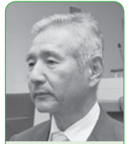
太田 芳彦 議員