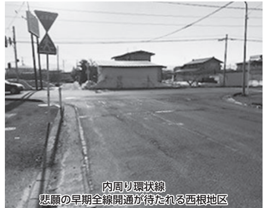
内周り環状線 悲願の早期全線開通が待たれる西根地区

陽光発電など自然エネルギーによる無散水消雪等の導入による交差点の除排雪、障壁の除去について伺う。