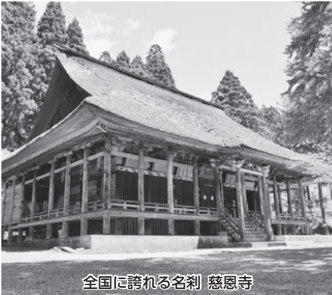
全国に誇れる名刹 慈恩寺

教育長 ①平成30年度に本体工事と展示工事の基本設計、31年度に本体工事と展示工事の実施設計、32年度と33年度で本体の建設工事、展示工事、外構工事に順次入る計