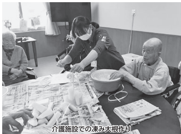
介護施設での凍み大根作り

ない事、労働に見合った収入が得られない事、職員の高齢化、経営母体によって待遇が違う事等を介護事業所の方から聞いています。