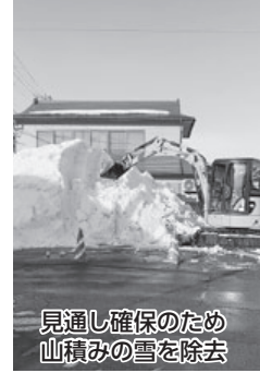
見通し確保のため山積みの雪を除去