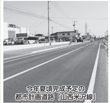
今年夏頃完成予定の 都市計画道路「山西米沢線」

県と調整しております。今後も県と調整を密にしながら、交付率を上げる努力をしていきます。