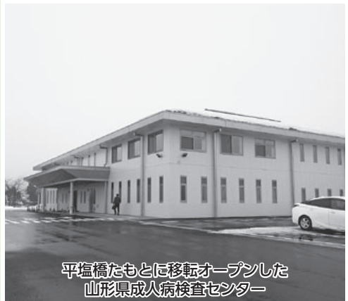
平塩橋たもとに移転オープンした山形県成人病検査センター

②受診票の事前送付、受診勧奨の個別送付、毎月20日の市報への検診日の掲載、がん征圧月間及びがん検診キャンペーンでの啓発活動