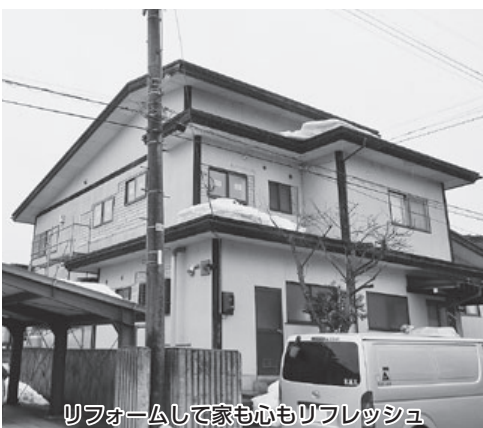
リフォームして家も心もリフレッシュ

②住宅建築推進事業補助金は経済波及効果が高い事業と考えており、平成30年度の景気動向を見極めながら、より効果的な事業として展開するよう努力いたします。