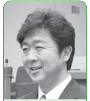
渡邊 賢一 議員