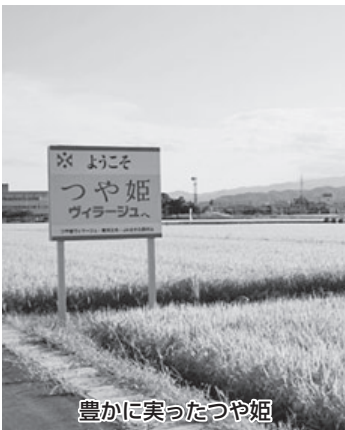
豊かに実ったつや姫

市長 国では、これまでの米の生産数量目標を国が配分してきた仕組みを代え、これからは需給バランスの予測を生産地へ情報提供を行うとともに減反作物の交付金を継続することで、米価安定を図ることです。今後の米価の動きや各産地の動向を注視し、必要な対策を検討していきます。