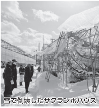
雪で倒壊したサクランボハウス

回答 ／パトロールや住民からの情報提供により随時除排雪を実施しているが、危険と思われる箇所については早急に対処する。