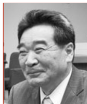
沖津 一博 議員