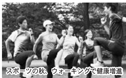
スポーツの秋、ウォーキングで健康増進

④市民の健康づくりと生涯スポーツの振興について「ラジオ体操」などと併せて「市民歌のびのび体操」普及のため、防災無線の有効活用を検討すべき。介護予防と心身の健康づくりの実践に向けた具休策が必要ではないか。