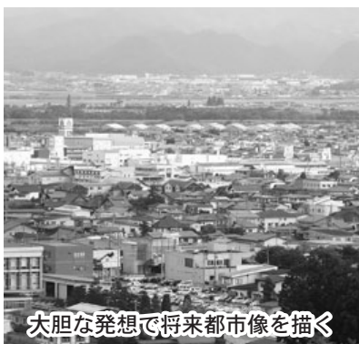
大胆な発想で将来都市像を描く

市長 ①計画目標や重点プロジェクトの評価等については、最終年の途中で進行中ですが、概ね初期