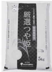
ふるさと納税返礼品の一部