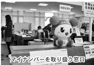
マイナンバーを取り扱う窓口

⑤自己情報に適切に関与する権利（自己情報コントロール権）は、基本的な人権と考えられているが、それを維持する方策は。