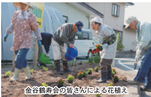
金谷鶴寿会の皆さんによる花植え

柴橋地区の真ん中で、高速度路と最上川に挟まれ、柴橋小学校がある2000戸余りの、コンパクトな集落がおらがまちです。区の事業「花いっぱい運動」は、5月にそれぞれの家でプランターに花苗を植え、11月まで沿道を花で彩るもので、8月に審査し新年会で表彰しています。