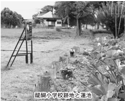
醍醐小学校跡地と蓮池

慈恩寺蓮を応援、見てくださる人々にやさしい場所を提供する。市道下道鬼越線と接続生活道と県道日和田松川線を小学校跡地内で小駐車場付きの道で結び、ミニパークとする。周辺生活道を跡地と県道利用の環状化はできないか。市長 この地域の3つの市道路線をつないで環状化が図られれば利便性は高まると思います。新たに用地を確保する必要があるなどの課題もありますが、できるだけ地元の要望を充分踏まえながら検討していきたいと思えます。