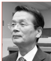
内藤 明 議員