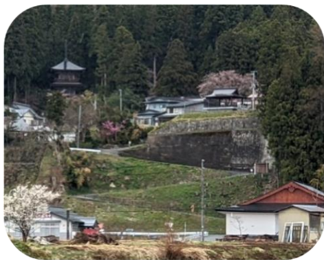
慈恩寺大橋付近から見える三重塔

この度、高松側から見た時に三 重塔を遮っていた樹木を伐採し、 慈恩寺大橋や陵西中学校のあた りからも三重塔が見えるようにな りました。5月から11月には三 重塔など慈恩寺の全ての堂舎を ライトアップする予定です。暗闇 の中に美しく浮かぶ三重塔をぜ ひお楽しみください。