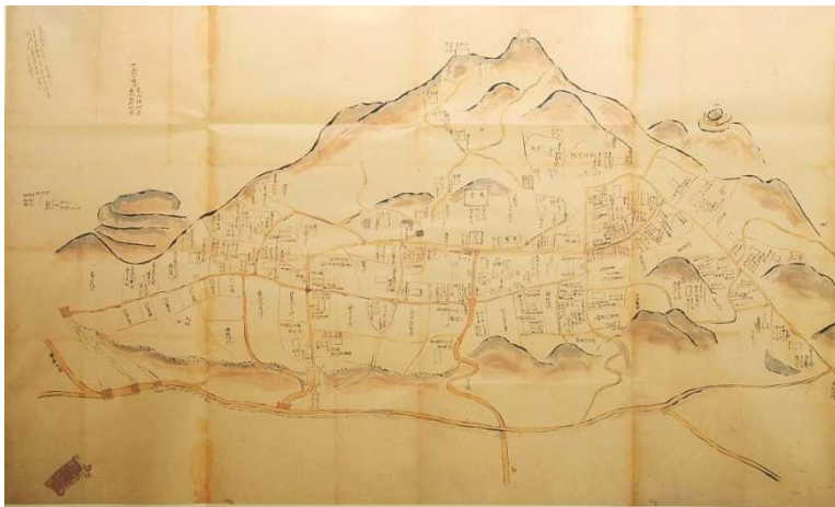
正徳六年 慈恩寺一山絵図 (1716年)

総合的な調査によって鎮護国家祈願寺で ある慈恩寺の日本史上での価値の高さが明 らかになってきました。その価値を示す土地 の範囲はどこかという史跡の本質を知る良 い機会となりました。 多くの皆様のご来場真にありがとうございました。