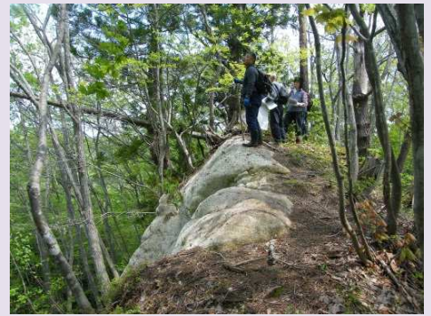
▲急峻な岩場の「剣天上」