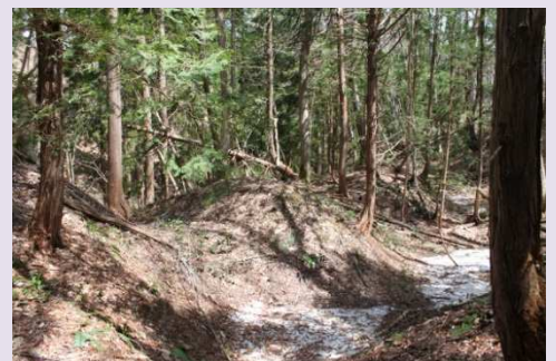
▲不思議な雰囲気漂う「四十八森」