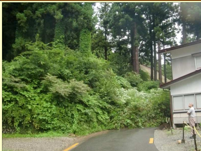
▲三重塔東側斜面崩落の様子 (7月18日午後5時頃撮影)

七月中旬から下旬にかけての豪雨は各地に多大な被害をもたらし、慈恩寺境内でも4カ所(崩落危険箇所含む)土砂崩落が発生しました。幸いにも人的被害はありませんでしたが、国史跡指定を目指す範囲内の土地形状に影響が出ました。 現在、崩落部や危険箇所は土砂が撤去され、ブルーシートで保護されています。災害防止や史跡の景観等への影響なども含め、早期の復旧・補強工事に向け本山慈恩寺はじめ関係機関で対応を協議しております。