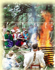
柴燈護摩会の様子