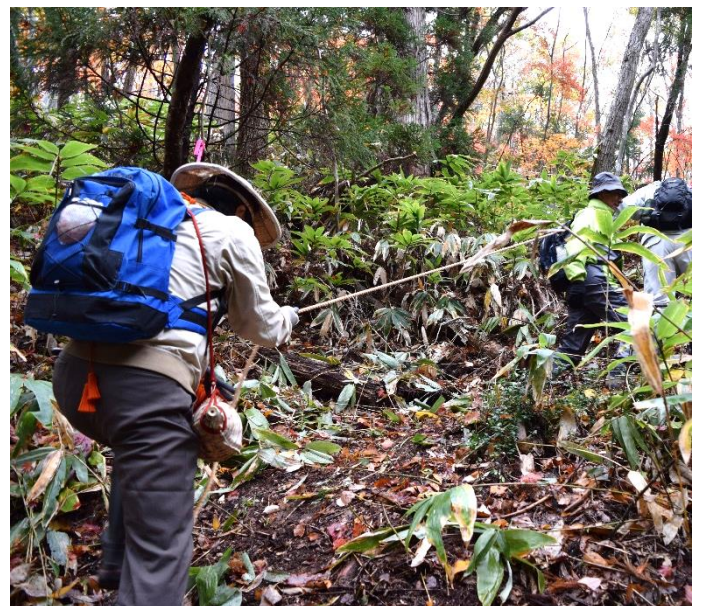
昨年度のように(急峻な斜面を登る)