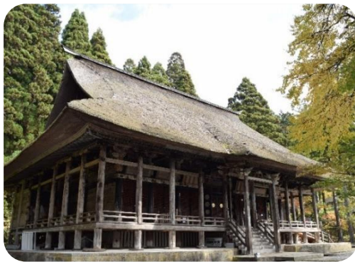
法会の様相を伝える本堂

現在策定中の「史跡慈恩寺旧境内保存活用計画」には、文化庁の指針に基づき、史跡の保存と活用を盛り込みます。江戸時代の慈恩寺境内の様相を良好にとどめており、日本の仏教信仰の在り方を知る上で重要であるとして、国史跡指定された慈恩寺旧境内。千年以上かけて造成・形成された佇まいと、その地中に残されている古代・中世の様相。さらに、建物や屋敷地、仏像、古文書、仏具など、慈恩寺の歴史のみならず、日本の仏教信仰の在り方を知る上で重要な要素が、史跡内には数多