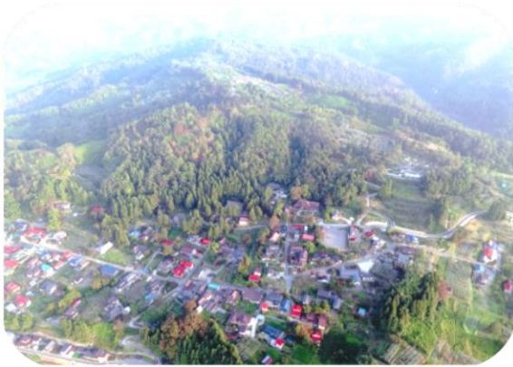
大寺院の様相を伝える景観

現在策定中の「史跡慈恩寺旧境内保存活用計画」には、文化庁の指針に基づき、史跡の保存と活用を盛り込みます。江戸時代の慈恩寺境内の様相を良好にとどめており、日本の仏教信仰の在り方を知る上で重要であるとして、国史跡指定された慈恩寺旧境内。千年以上かけて造成・形成された佇まいと、その地中に残されている古代・中世の様相。さらに、建物や屋敷地、仏像、古文書、仏具など、慈恩寺の歴史のみならず、日本の仏教信仰の在り方を知る上で重要な要素が、史跡内には数多