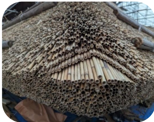
新たに葺いた軒の隅部分

はほとんど見たことがないものです。隅から茅を積み重ねる作業は、何度もやり直すほど難しかった、という話でした。 職人さんたちの手で少しずつ完成に向かっていきます。茅葺作業は今年8月頃まで行う予定です。