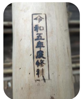
⑤交換した部材には「令和五年度修補」の焼印