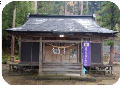
工事前の熊野神社拝殿

今回の修理では、拝殿の根太は、かつて違う建築物で使用されていた材と見られることが明らかになりました。また、根太や屋根根板からは、墨書(ぼくしよ)が発見され今年秋の慈恩寺テラス企画展「職人たちの遊び」熊野神社拝殿の落書き」で写真を展示しました。