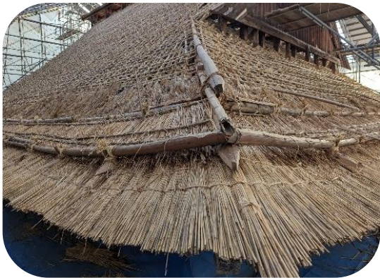
茅は屋根の軒から最上部に向かって葺いていきます。

現在は、茅葺作業をしており、屋根修理は令和6年8月頃完了予定です。その後は雨落側溝等の工事を行います。