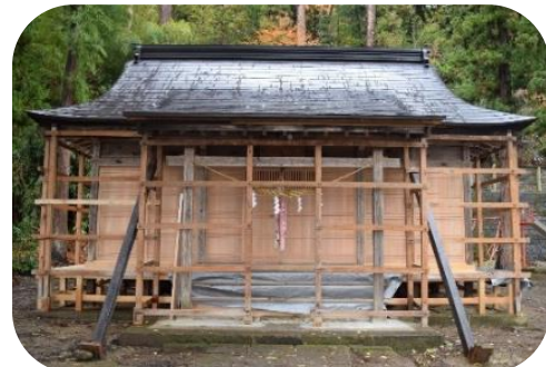
工事の完了した熊野神社拝殿。現在は雪囲いがされています。