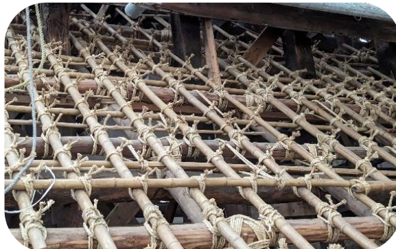
④下地の縄は全体的に緩んでいたため、新たな縄で締め直し、折れた竹は交換しました。