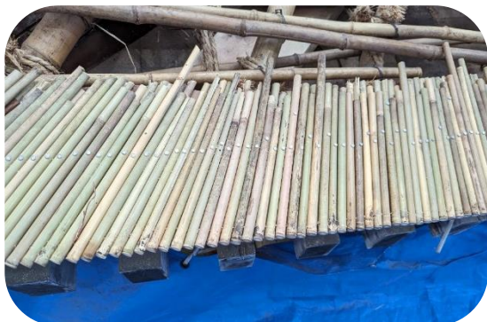
③新調された四隅の篠竹。交換前の篠竹は約70年前のものと考えられます。