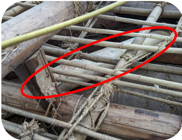
①丸で囲んでいるところは、軒先を支えるために新たに加えられた桔木(はねぎ)。

令和4年10月から開始した保存修理工事は、開始から1年が経過しました。現在、工事は順調に進んでいます。 ○工事の進捗状況