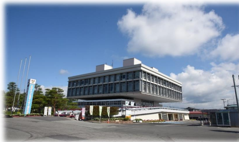
市役所庁舎（日本近代建築100選）