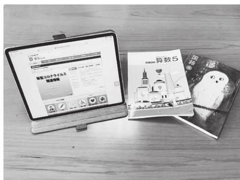
これから期待されるICT教育

② 「GIGAスクール構想」の早期実現に向け、小中学校の最高学年への導入を優先し年度内の整備を行うべく進めてまいります。