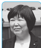
太田 陽子 議員