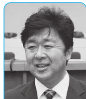
渡邊 賢一 議員