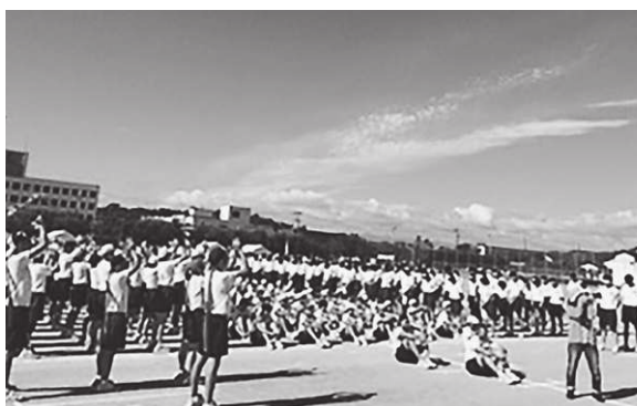
一斉休校により学校行事も大幅な見直しを余儀なくされている（写真：令和元年度陵東中学校大運動会風景）

教育長 県教育委員会が部活動の段階的再開と他校との交流を可能とするガイドラインを公表したことを踏まえ、西村山中体連、中学校長会、教育長会は急遽会議を招集し、代替大会について検討を行い、実施可能な競技については7月中旬までをめどに実施できることを決定しました。市としても、会場借用や地元業者を活用しての生徒輸送費補助など、できる限りの支援をしてまいります。