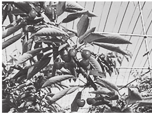
さがえブランド・大玉「紅秀峰」

と供給のバランスを保ち、値崩れ防止の後押しをする考えです。 ③ さくらんぼの消費拡大に向け、ツイッターを活用した取組をしており、この参加者とそのフォロワーの延べ7万人以上に情報発信しました。また、観光向けのさくらんぼをふるさと納税返礼品として取り扱い、支持を受けています。 ④ 新型コロナウイルス感染症の感染抑制と経済活動の両立は喫緊の課題であると強く認識しております。今後、街づくりやイベント企画などについては、新しいスタイルが社会活動全体に渡ることを前提とした施策の展開が必要であると思っております。