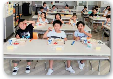
さくらんぼ うまいな～