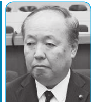
古沢 清志 議員

と供給のバランスを保ち、値崩れ防止の後押しをする考えです。 ③ さくらんぼの消費拡大に向け、ツイッターを活用した取組をしており、この参加者とそのフォロワーの延べ7万人以上に情報発信しました。また、観光向けのさくらんぼをふるさと納税返礼品として取り扱い、支持を受けています。 ④ 新型コロナウイルス感染症の感染抑制と経済活動の両立は喫緊の課題であると強く認識しております。今後、街づくりやイベント企画などについては、新しいスタイルが社会活動全体に渡ることを前提とした施策の展開が必要であると思っております。