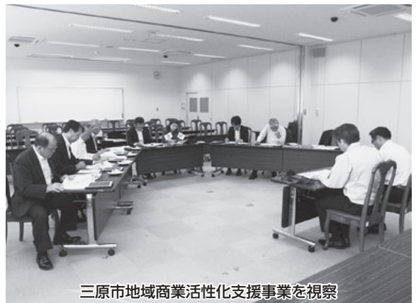
三原市地域商業活性化支援事業を視察

事業を開始した背景には、多様な製造業が集積していることおよび厳しい経済状況があり、これらに対応するため各対策事業を矢と見立て、平成25年度に8本の矢として開始。平成26年度に16本の矢、平成28年度には20本の矢、平成29年度からは22本の矢となり、年々内容を充実させている。事業項目は3年に1回見直しし、利用がなければ項目から外している。 事業内容は、設備投資や人材育