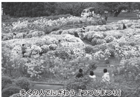
多くの人でにぎわう「つつじまつり」

議員 4月から6月のイベントを対象にポスターを作成するというのだが、具体的にどこへ配布するのか。