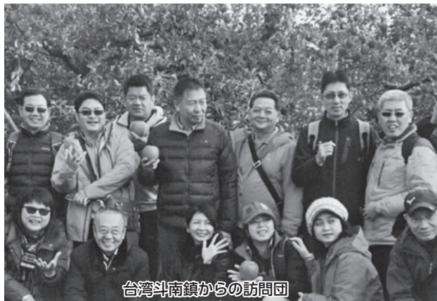
台湾斗南鎮からの訪問団

①9月の台湾経済ミッションに市長が特別顧問として参加した。訪問は経済活動が主目的であり、現地政財界人との交流・懇談により相互理解を深めて来た。今後の交流拡大へ期待が膨らんでくる。さらなる交流推進の必要性を伺う。 ②市長の台湾斗南鎮訪問、そして斗南鎮長の「将来へ向け姉妹都市を結べたら嬉しい」とのコメント、さらに昨年11月の斗南ロータリークラブ一行の本市訪問等、このような交流を踏まえ姉妹都市締結の可能性について見解を伺う。 ③小学校教育で情報化やグローバル化に対応するため、英語学習の推進をした。国際感覚を養う子どもたちの海外交流について伺う。 市長 ①今年2月、国連世界観光会議が山形市で開催され、その際に最上川ふるさと総合公園で実施される第3回やまがた雪フェスティバルの視察も予定されています。