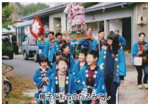
楯子ども会のたるみこし

さて、昨年は、市議会として政務活動費のホームページ上での公開やタブレット端末の導入など、県内の中でも積極的に議会改革等に取り組んできたと自負しておりますが、まだまだ取り組むべき課題は数多くあると認識しております。議会に対する皆様のご意見も、併せていただくことをお願いいたします。