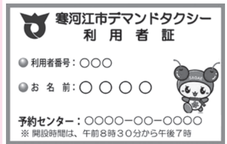
寒河江市デマンドタクシー利用者証

市長 ①デマンドタクシーを利用できるエリアは、バス停留所から500mより遠い地域、また、一つの地域で、地域の半分以上が500mより遠いということ等を基準としており、路線バスと競合することがないよう調整をしています。エリア拡大には、バス事業者