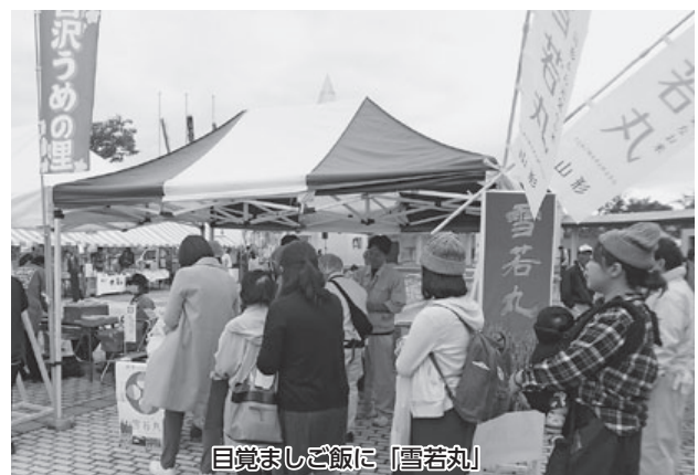
目覚ましご飯に「雪若丸」

米の消費は昭和37年を頂点に毎年減少傾向にある。ピーク時と比較すると半分の消費となり、米の