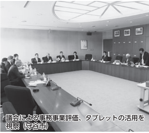
議会による事務事業評価、タブレットの活用を視察（守谷市）

所沢市の議会基本条例の検証および評価については平成19年、専門的知見の活用を図るため、地方自治法に基づく調査研究を進め、議会基本条例の制定・評価・改正に取り組んだ。平成21年、基本条例施行以後毎年度、市民の負託に応えられる議会の実現および議会運営の活性化を図るとともに、説明責任を果たすために、議会が実施する事業・議会改革について、条例に基づいた議会評価を行って