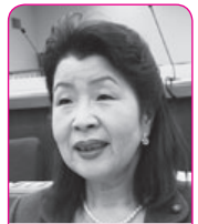
辻 登代子 議員