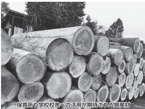
保育所や学校校舎への活用が期待される県産材

市長 ①森林整備については、所有者から要望をお聞きしながら、資源活用と鳥獣害被害防止の観点からも市全体の問題として捉え、県や西村山4町と連携し検討して