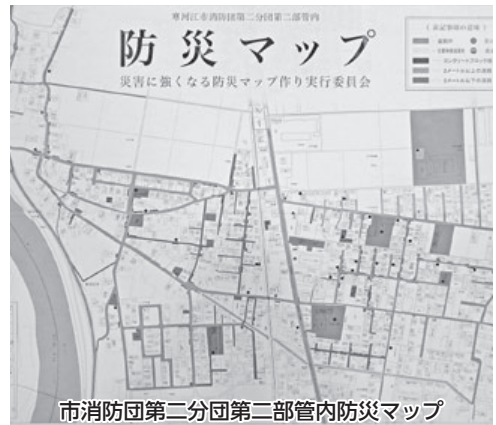
市消防団第二分団第二部管内防災マップ

①災害図上訓練D-I-Gの利点は、地域で起こりうる災害の現状を知り被害想定が具体的に描き出され、