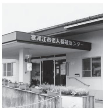
老人福祉センター白岩温泉 「小さな温泉大きな幸せ しらいわ温泉」

市長 保健所の指導を受け、浴槽等の洗浄消毒の徹底等を行うとともに、老朽化した設備の負荷にならないよう最善の方策をとるべく、いろいろな方法、経費の検討を行いました。改修の方法に紆余曲折があり、休止状態が長期間になってしまいました。再開のめどは2月初めを予定しています。皆様にはご心配とご迷惑をおかけしておりますことをお詫び申し上げます。