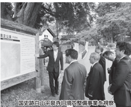
国史跡白山平泉寺旧境内整備事業を視察

あわらの健康「食べ・歩き」おばあちゃんの味の日事業では、毎月25日をおばあちゃんの日と定め、広報誌等に伝承料理を掲載し、学校給食でも採用している。たくましい保育教育事業では、あわら式幼児教育の実践事業として、公立こども園での運動指導やしつけ等を身に付けさせている。エコと自然のポータルプロジェクト事業では、市民会議で発案し、グリーンカーテンやごみ減量化を市民が中心となって推進している。子育て環境や住環境等を向上させ、まちに魅力を感じてもらおうとで移住・定住、交流人口の拡大を目指していた。