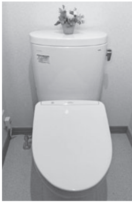
支援制度を活用して改修したトイレ

市長 ①毎年春と秋の2回、市内約200社を対象に行っている業況調査では、平均的な業況を100とした場合、今年度秋の数値は85・5という結果で、今年度春から4・3ポイント、前年度同期よりも0・4ポイント改善しており、各事業者の判断では徐々に改善し