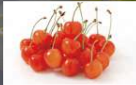
特産品 さくらんぼ

千年超の歴史を誇る東北随一の古刹慈恩寺。かつては3カ院48坊からなる巨大寺院で周辺一帯が国指定史跡。境内には、本堂(国重文)、三重塔などが厳かに建ち並び、十二神将像等の国重文仏像も多数所蔵。