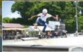
スポーツに親しむ街

毎年9月、800年以上の歴史を持つ寒河江八幡宮の例大祭に合わせて開催。中でもフィナーレを飾る神輿の祭典は東北最大規模!大勢の担ぎ手が寒河江の夜を粋に盛り上げます。