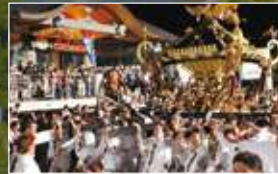
寒河江まつり「神輿の祭典」

寒河江生まれの品種「紅秀峰(べにしゅうほう)」をはじめとする、さくらんぼの生産が盛ん。お裾分けでたくさんいただくのが、寒河江あるあるのひとつ。