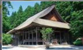
国史跡 慈恩寺 旧境内

他の誰かのモノサシではなく、 自分が思う「最高」に出会える場所が、ここにあります。