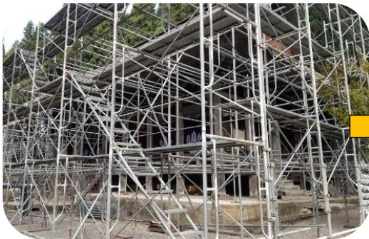
①10月22日：足場を地上から組んでいます。