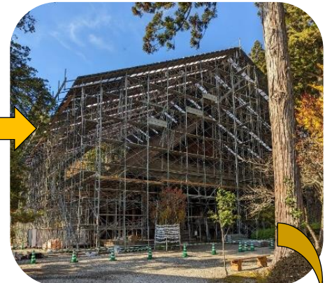
③11月10日：足場も完成し、トタンで屋根も覆われました。