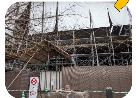
④11月18日：シートで覆い始めました。当分は外観が見られません。