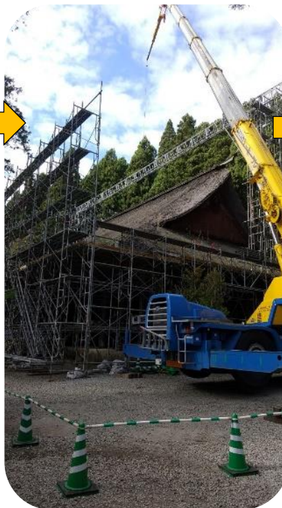
②10月28日：高いところの資材運びはクレーンを使っていました。