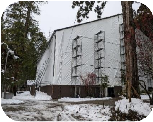
⑤12月22日：全体がシートで覆われました。境内は雪景色です。