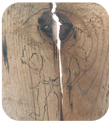
ふんどし姿の落書き