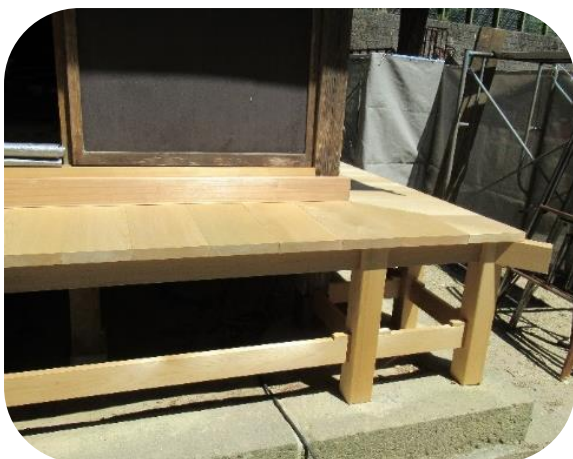
「縁廻り」が新たに組み立てられました。

②熊野神社の修理履歴について 記録によると、熊野神社は度々屋根の葺替工事などが行われてきました。 ・寛政6(1794)年、慈恩寺熊野堂(本殿)杉皮葺 ・天保9(1838)年、熊野堂(本殿)屋根葺替 ・昭和28(1953)年、熊野神社本殿トタン葺に改修 ・平成25・26(2013・14)年、熊野神社本殿屋根修理 明治元(1868)年に出された神仏分離令以前は、神仏習合のため熊野堂と呼ばれていました。地元の方々によって、300年以上大切に守られてきたことがうかがえます。現在、本殿は県指定文化財です。