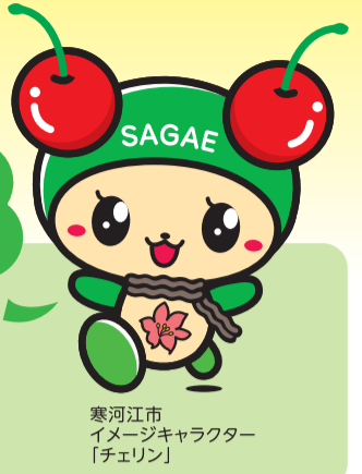
寒河江市 イメージキャラクター 「チェリン」

路線バスなどが走っていない地域の乗合タクシーです！ ご自宅前と共通乗降場間を走ります！