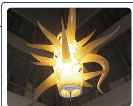
「生誕」(市役所2階ホール) 市庁舎の吹き抜けにある光る彫刻「生誕」。「建物の直線に「ツノ」の曲線で対抗させ、生みの苦しさとエネルギーを表現した」という言葉を残しています。世界的芸術家、岡本太郎氏の作品です。