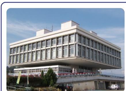
「寒河江市役所庁舎」 市民との連帯感をたかめるため、議場と執務棟を立体的に分離して、議場を地上階に、2階の市民窓口の上に執務室をもってきてあります。重層する機能の中間に創り出される都市の緑台をイメージして設計されました。世界的建築家、黒川紀章氏の設計で、日本の近代建築100選に選ばれました。