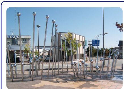
「FORZA」(みこし公園) 市民との多様な接点を秘めた体験型のモニュメントで、工業生産された材料を活用し、子供からお年寄り、ハンディのある方まで楽しめる「思い出を育む空間装置」としてデザインされています。東北芸術工科大学教授三橋幸次氏、准教授楠木泰彦氏の作品です。