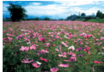
NO.29 (鈴木 孝)