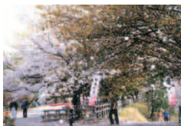
NO.39 (寺崎 隆)