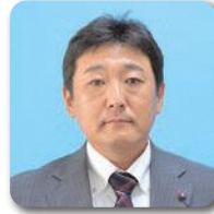
菖蒲 修 白岩 2期