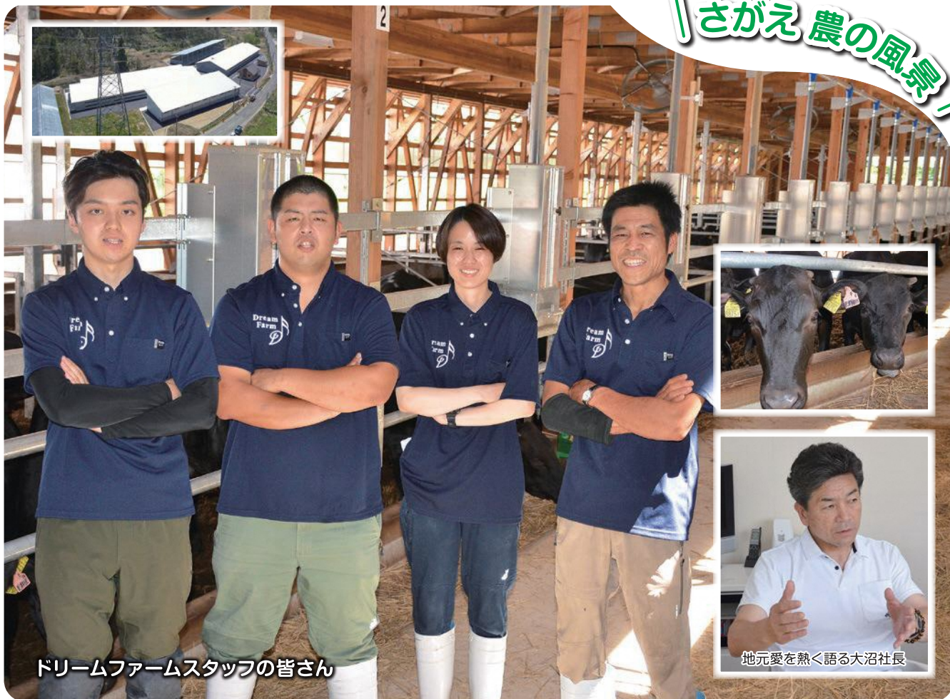
ドリームファームスタッフの皆さん