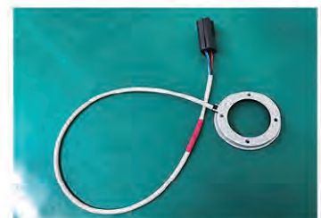
ベアリングセンサー