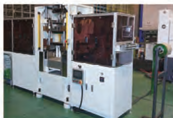
お弁当カップ成型機