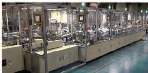
自動車用電気リレー組立機