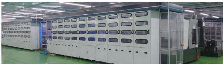
ラック式マシニング自動供給装置