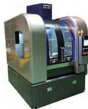
ロータリー研削盤：SGR-700R