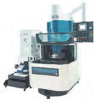
ロータリー研削盤：SGR-700SP