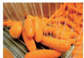
作業風景 (人参洗浄)