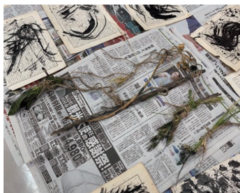
自然素材で作られた筆とドローイング

文化センター内勤労青少年ホームの娯楽談話室にて、自然の素材を用いた筆づくりと実際にその筆を使用したドローイング体験を実施しました。談話室の前には植物や木々、遊具が置かれている広いスペースがあります。そこで子どもたちと木の枝や植物を採集して筆をつくりました。子どもたちが選び取る素材によって筆の形状やドローイングに現れる線が異なり、とてもおもしろかったです。また、ドローイングでは子どもたちが伸び伸びと自分にしか描くことができない線表現していました。今後は大型の筆の制作や、広範囲のドローイング体験を企画し、自然と触れ合いながら各々の線を描く体験を実施していきたいと思えます。