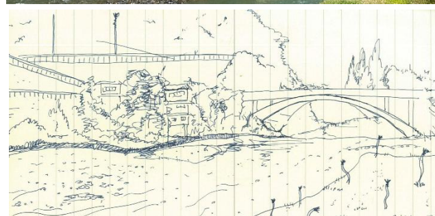
臥龍橋をリサーチしたときの写真とドローイング