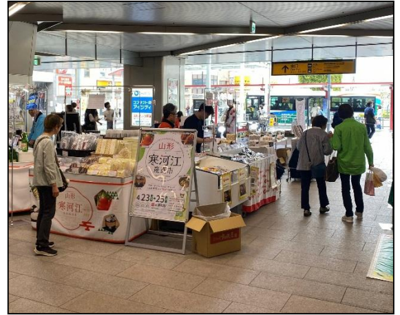
イベントブースの様子

無事に成功するか不安な気持ちを持ちつつドキドキでしたが、最終日まで大きな問題も起きずやり通すことができました。各商品もほぼ完売と、売上も目標まで行くことが出来ました！スタッフとして多くのお客様と接することができ、リアルでお客様の声を聞くことができたのは大きな収穫でした。このようなイベントを今後も行えるよう精進していきます！