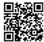
▲携帯電話(ガラケー)