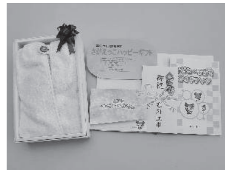
さがえっこハッピーギフト

本年度から4月以降に出産されたお母さんとその赤ちゃんを対象に「さがえっこハッピーギフト事業」がスタートしました。新生児訪問の際に、出産を祝って子育てを応援するメッセージカードを添えて記念品をお贈りしています。