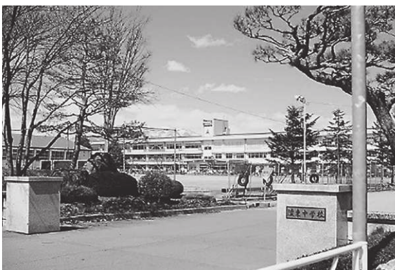
新時代の主役たちが巣立った陵東中学校校門前

教育長 社会総がかりで児童生徒を育ていくためには、学校、家庭、地域の連携・協働体制の構築は不可欠です。いじめや不登校の課題解決についても個人情報に配慮しながら地域社会と課題認識や価値観を共有し、対策を強化していくことは、これまで以上に必要になってくると考えます。