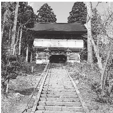
整備された慈恩寺の山門前石段

②ガイダンス施設の中に、飲食やお土産品を購入できるスペースを予定しており、そこでは地元の食材を活用しながら軽食を提供する計画です。また、仁王坂途中の休憩所では、催事の際には観光客の皆さんにお茶などを提供し、歓迎したいと考えております。