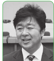
渡邊 賢一 議員