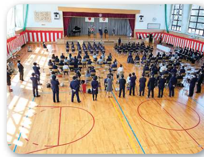
在校生不在でガラガラの体育館