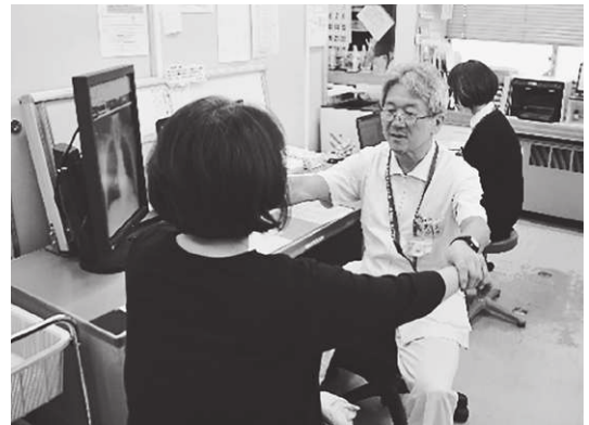
市立病院の診察風景

①厚生労働省が診療実績等を基に寒河江市立病院を再編・統合の議論が必要とリストアップしたこと