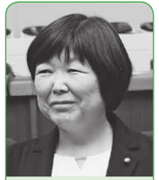
太田 陽子 議員