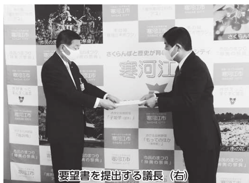
要望書を提出する議長（右）

本県でも3月31日に感染者が初確認されてから、ほぼ毎日感染者が発表され、寒河江市への感染も大いに懸念される状況となったことを踏まえ、4月15日、市議会では市長に対し「新型コロナウイルス感染症対策」について要望書を提出しました。