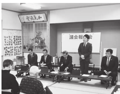
議会報告会の様子(会場：美原町公民館)