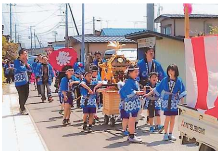
元気に巡回！子供みこしパレード

これからも、より美しく快適な環境の中で生き生きと暮らしていける高松の構築を進めてまいります。