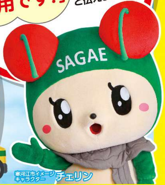
寒河江市イメージキャラクター チェリン